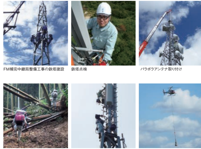
FM補完中継局整備工事の鉄塔建設 鉄塔点検 パラボラアンテナ取り付け 豪雨災害によるテレビ放送所停電対応(徒歩にて緊急出向中) 送信空中線点検 ヘリコプター資材運搬

私の職場は世界一高いタワーの中にあります。そう、東京スカイツリーです。高さ634mの観光スポットとして有名ですが、関東広域圏に向けて電波を届ける放送所でもあります。私の仕事は放送設備機器の更新やメンテナンスです。ひとくちに放送設備と言っても、「電波」はもちろんのこと、監視・制御のための「通信」、機器を動かす「電源」など、多くの技術の集合体であり、幅広い技術力が必要とされます。ミスの許されない仕事ですが、公共の電波を守るため、日々奮闘しています。あなたの技術力をスカイツリーで活かしてみませんか?(高いところ好きな人大歓迎!)