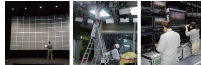
8K伝送システム ワイヤレスマイク整備工事 スタジオモニターアレイ工事