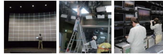
8K伝送システム ワイヤレスマイク整備工事 スタジオモニターアレイ工事