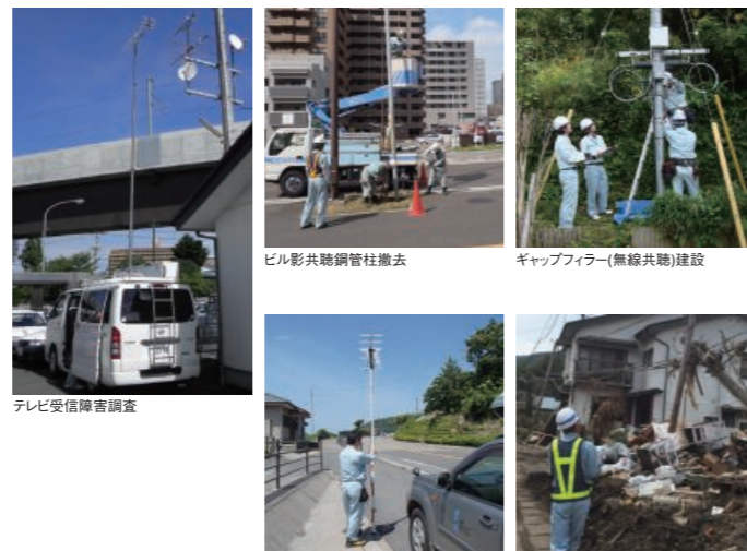
ビル影共聴銅管柱撤去 ギャップファイラー(無線共聴)建設 テレビ受信障害調査 エリア電界強度測定 台風によるテレビ共同受信施設被災対応(施設点検作業)

私の仕事は電波のお医者さんです。テレビやラジオが受信できなくなると、まず電測車と呼ばれる特殊車両等で電波を測定し障害原因を調べます。妨害電波が原因の場合は、発信源を突き止め電波障害を解消し、良好に視聴できるように行います。山間部や高層ビルなどの影響で電波が届かない場合は、ケーブルや電波でテレビの信号を運ぶ施設を設置し、各世帯に信号を届けます。九州・沖縄は台風などの自然災害も多く復旧作業に苦労する時もありますが、共聴で見ている田舎のおじいちゃんおばあちゃんから「テレビが一番の娯楽、おかげできれいに映るようになりました」と感謝される時が、この仕事をやってよかったと感じる瞬間です。