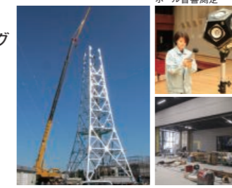
鉄塔建設工事 スタジオ工事