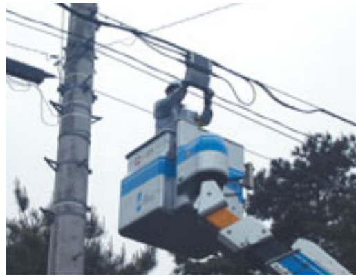
ケーブルテレビの広帯域化工事 (八戸テレビ放送)