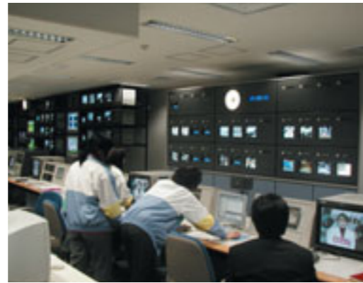
東経110°CS放送 (当社 小山台オペレーションセンター)

NHKアイテックは放送・通信分野の総合技術会社として、地上テレビ放送のデジタル化をはじめ、BSデジタル放送・東経110°CS放送の送出設備の施工・運用など、テレビ放送のデジタル化に貢献しています。また、地域の情報通信基盤の役割を担うケーブルテレビ施設新設・高度化、地域イントラネット基盤施設の設置などに関しても、全国の自治体やケーブルテレビ局をサポートしています。